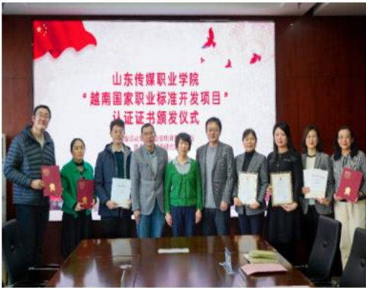
图 1 开发越南国家职业标准项目

成果社会影响广泛。专业群教师承接的“发展中国家电视高清技术应用与管理研修班”“孟加拉国媒体研修班”等三期援外研修班同期开课，为“一带一路”建设提供了人才支撑。完成《摄影摄像师》越南国家职业标准开发项目，获得越南国家认证，充分发挥教师在职教出海、“一带一路”建设中的积极作用。