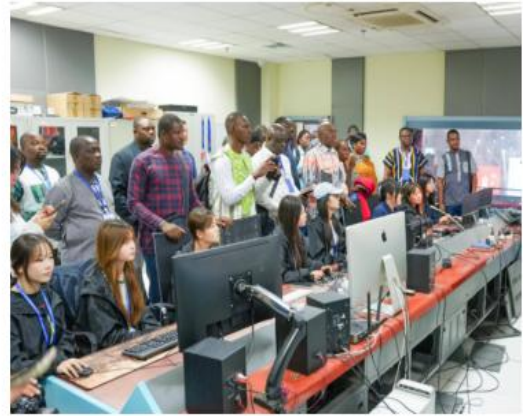
图 2 服务“一带一路”援外研修班开课

学生职业竞争力显著增强。学生完成的《让梦想飞》等 53 项生产式实训项目在央视、省广播电视台等平台播出，创作的《孔子出仕》等节目在学习强国播出，电影《光影学徒》《当他们不再冷漠》等成功在国家电影局立项。为全省融媒体中心等传媒行业输送毕业生 9600 余人，有力支撑了媒体融合国家战略，培育全国广电总局技术能手 7 人。