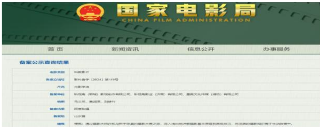
图5 《光影学徒》开机仪式、国家电影局立项