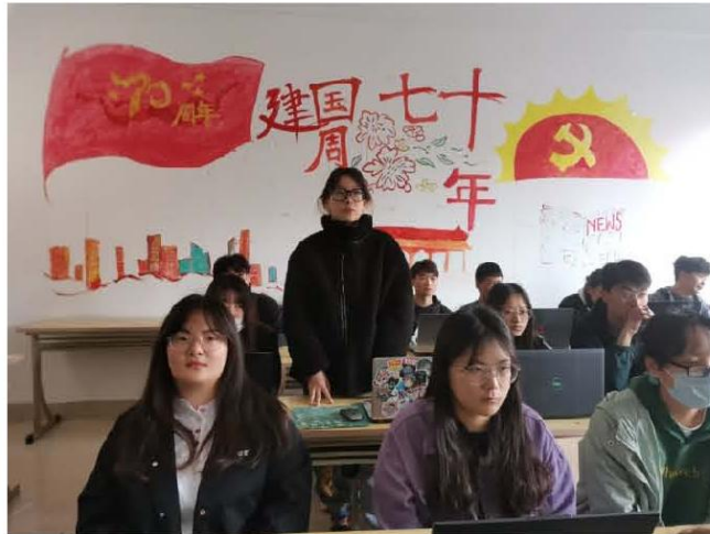
图片4 小组讨论后学生代表发言