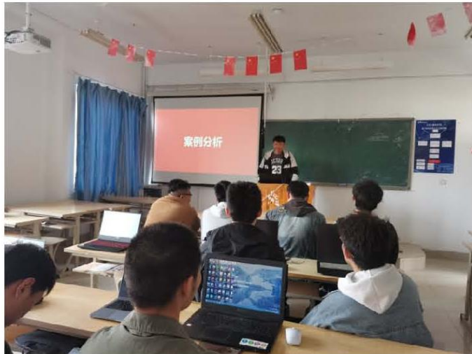
图3 学生代表对案例分析发言

此处融入思政元素：从褚橙文案海报，教育学生85岁的褚时健老人，把跌倒当成了爬起，面对人生的波澜，他流过泪，也曾黯然神伤，但是他锲而不舍的励志精神、不服老、不服输的创业精神值得我们学习。