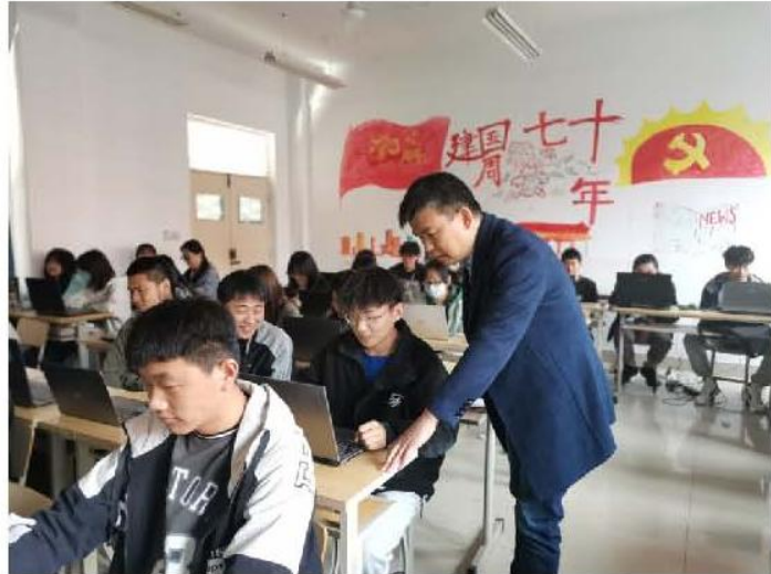
图5 教师指导学生完成课中实训