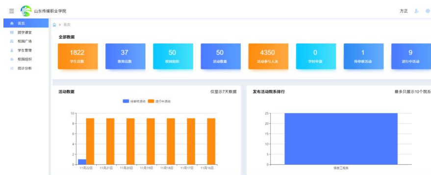
图一，学院第二课堂—趣拓校园首页

第二课堂是在共青团中央改革的背景下，围绕高校立德树人的根本任务所开展的新型综合素质教育模式，适应高等教育综合改革、全面推进素质教育的形势需求，我院全面推行“第二课堂成绩单”制度，信息工程系作为第二课堂工作试点单位，主要在思想成长、实践学习、志愿公益、创新创业、文体活动、工作履历、技能特长七个模块开展第二课堂。