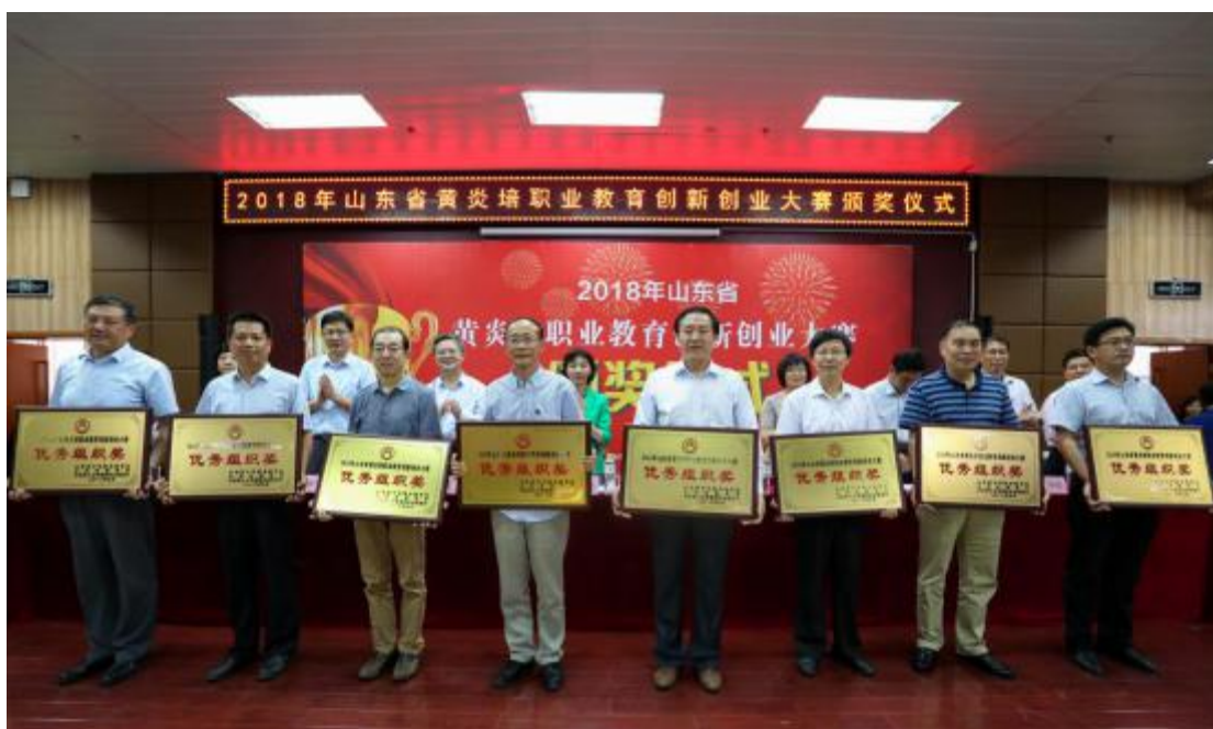
图三，黄炎培职业教育创新创业大赛颁奖仪式