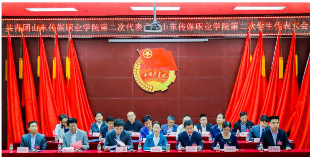
图十四，学院举办共青团山东传媒职业学院第二次代表大会