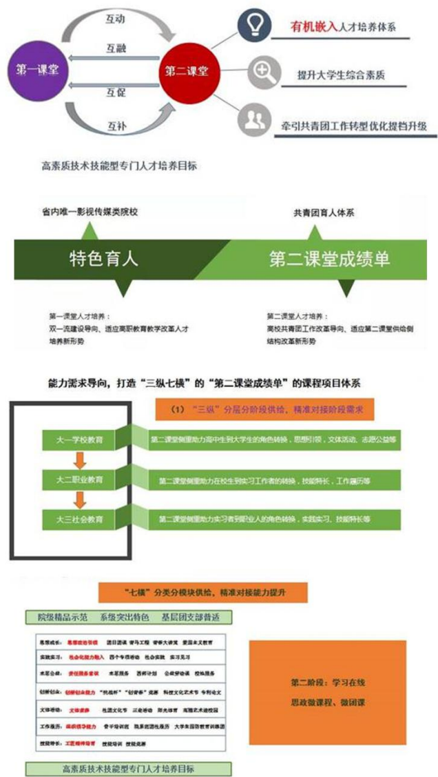
图三，学院第二课堂三纵七横框架图

能特长七大特色课程项目体系。我院运动会期间运用"第二课堂成绩单"制度圆满举行各项活动。