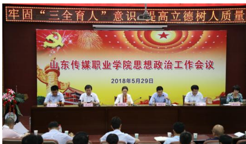
图十二，学院召开牢固“三全育人”意识 提高立德树人质量思想政治工作会议

思政工作体系，学院首次召开全院思想政治工作会议，基于全院大思政工作理念，制定下发《山东传媒职业学院思政政治教育工作考核指标体系》和《山东传媒职业学院思政政治教育工作考核评议实施办法》，推动意识形态和思政政治工作制度化、体系化、长效化。不断健全完善全员育人、全过程育人、全方位育人的思政工作体系。同时学院将以课程改革为抓手，打造既有深度又有温度的思政课程，构建立体多元的课程思政体系。