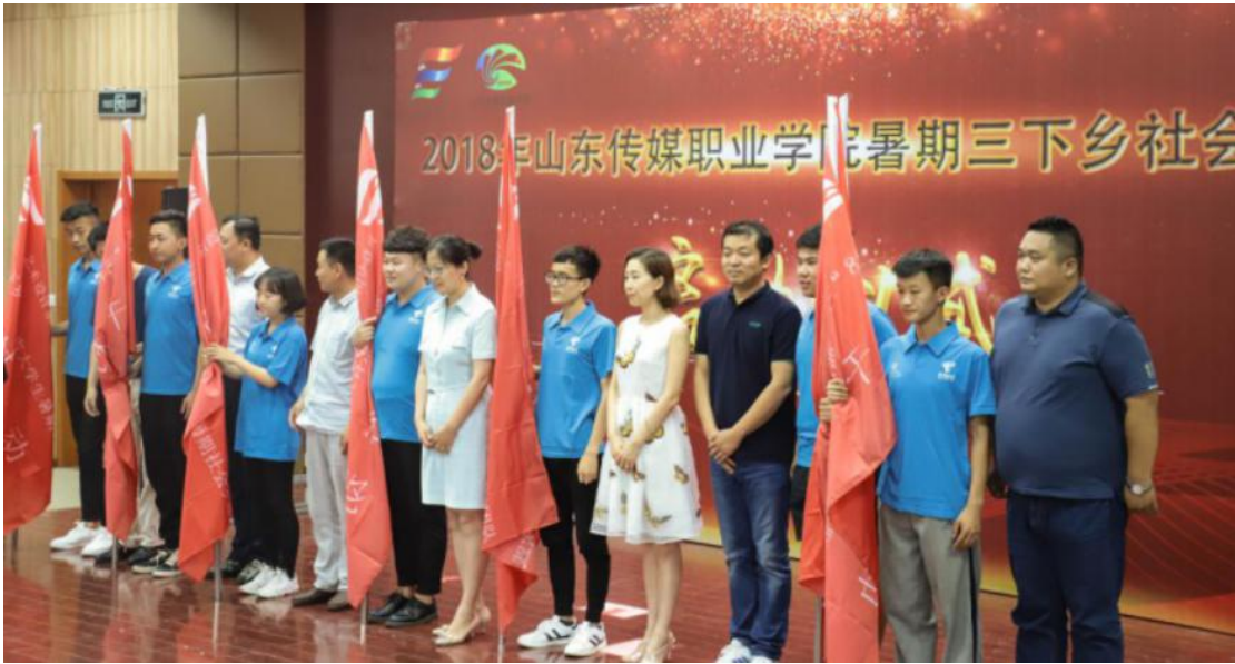
图七，学院三下乡暑期社会实践授旗仪式

高等职业教育只有坚持技术教育和人文教育并重的教育理念才能健康持续的发展。学院国学院认真贯彻习近平新时代中国特色社会主义思想理论，2018 年开展了 17 次形式多样、内容丰富的国学教育活动。通过国学经典的熏陶，帮助学生明白做人做事道理、准则和方法，不断提升精神境界，培养和弘扬以爱国主义为核心的民族精神，也有助于大学生形成正确的人生观和价值观。作为传媒类职业院校，通过开展国学教育，是的学生的审美情趣更浓，在专业课学习和创作中，想象力和创造力更强。