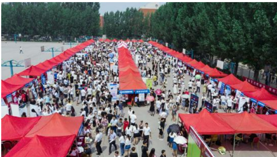
图一，第九届毕业生就业招聘双选会现场

(3) 创业大讲堂活动： 开展系列创新创业助推活动，致力营造良好的创新创业氛围。学院开展了 7 场“创业大讲堂”活动。邀请了省内知名创新创业教育专家、企业家、优秀创业毕业生代表等，通过举办讲座、报告会等形式，教授学生创业知识和技能。邀请章丘区市场监督管理局工作人员，针对创业学院创业园大学生创业实体项目负责人和有创业意愿的大学生开展工商注册流程、大学生创业政策宣讲等活动，引导学生掌握国家、省、市创业政策，明确了学生创业方向，提高了学生创业本领，助推了大学生创新创业服务。