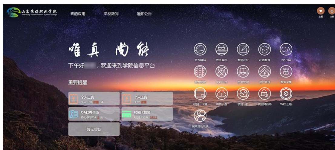
图十三，学院主页 OA 系统登录页面

息、一卡通、宿舍管理、办公自动化等 6 个已有信息系统数据资源的共享互通。完成了 OA 办公自动化平台和手机端的建设。制作上线公文流转、会场安排、公章使用、教室预订等各项流程 32 条，为实现无纸化办公进行了有益探索。完成信息化运维中心建设升级项目，运维中心是智慧校园的枢纽，其环境建设是保证校园网络及信息系统正常运行的关键。逐步推进学院软件正版化工作。为加强信息系统和各类软件的规范化管理，从源头上减少信息安全事件的发生。