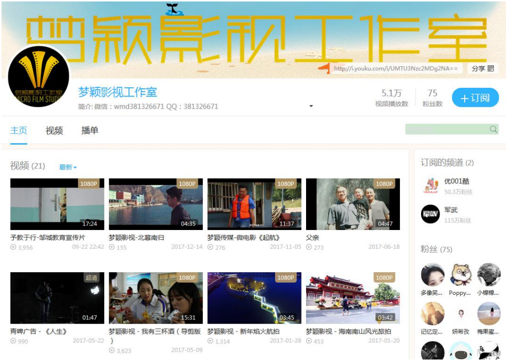
图二，梦颖工作室作品展示

立足于章丘大学城大学生的本地生活，在老师的带领下完成了多篇五万次以上点击率的文章推送，正逐步成长为在章丘本地颇有影响力的大学生创业团体。“梦颖工作室”、“不时映画工作室”等多个团队，参与广西建省 60 周年大庆宣传片《相约广西》的拍摄和纪录片《壮美广西》、《秘境幽兰》、工匠纪录片《百工图》的拍摄，其中的多部作品都将在央视 1、4、9 套和广西卫视播出。