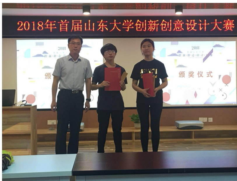
图六，山东大学创新创意设计大赛获奖现场