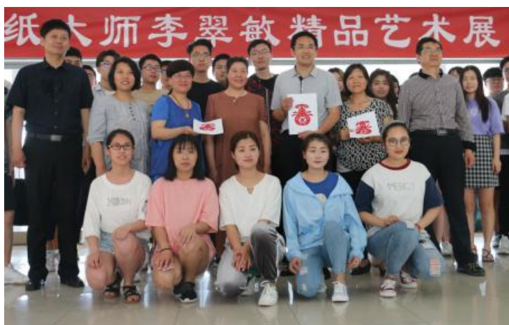
图八，学院第二届民俗文化艺术节系列活动之《剪纸艺术展》