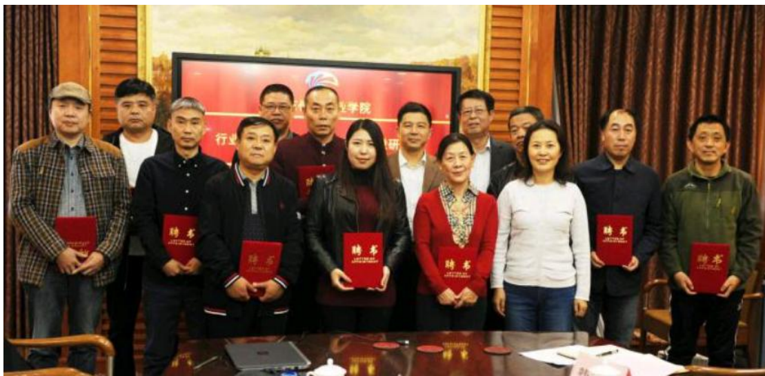
图十一，学院领导为受聘专家颁发聘书