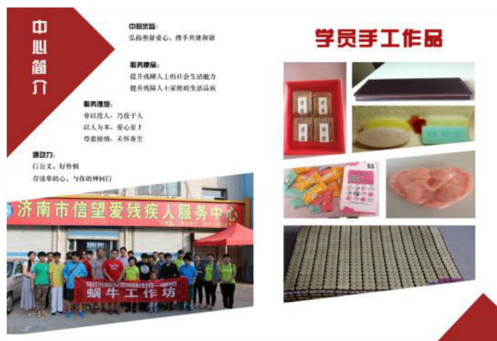
图十，我院学生设计的“信望爱”年报封面封底