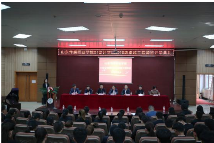
图九，校企合作班开学典礼

山东传媒职业学院与天津滨海迅腾科技集团校企合作“2018 级卓越工程师班，将大数据、云计算、电子商务、物联网、人工智能等前沿信息技术引入教学实践和改革，逐步转变人才培养模式，由“2+1”模式向“2+0.5+0.5”模式转变，进一步完善了学院在校企合作方面的人才培养体系建设。重点建设“一个平台”、推进“两个融合”、实施“三个对接”，校企共同推进人才培养。