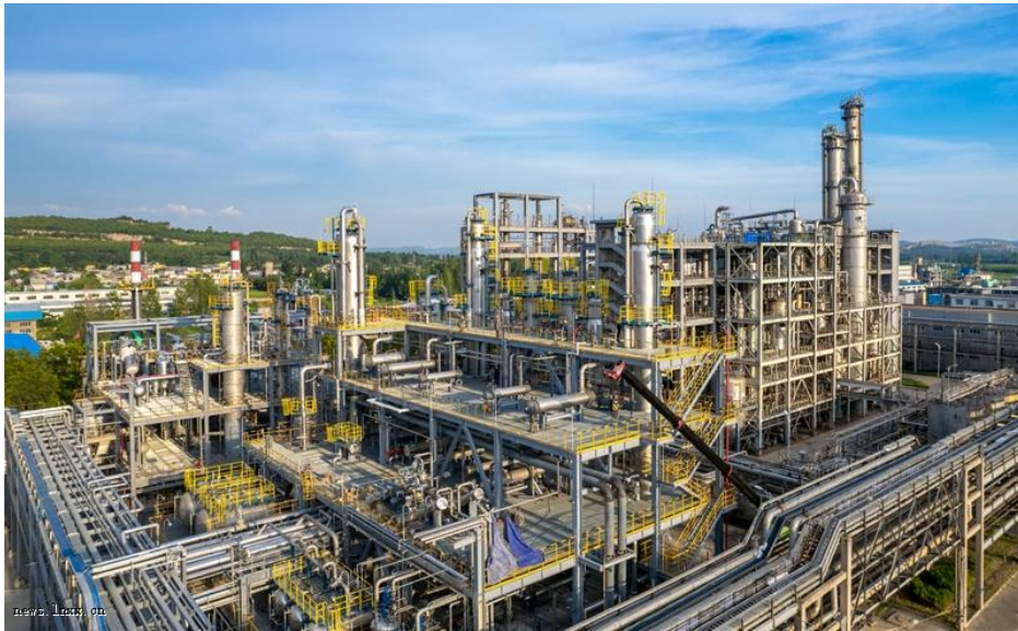
裂解法制醋酐项目

裂解法制醋酐项目建成投用，醋酐综合产能居亚州第一，公司成为国内唯一一家拥有两种制醋酐工艺企业。尼龙6切片项目10月10日项目一次投料成功，提前两个月完成能源集团考核节点，形成氨基新材料领域规模化和一体化生产格局。