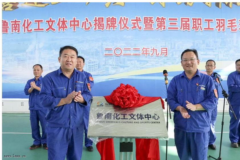
鲁南化工文体中心揭牌仪式

山东能源集团党委书记、董事长李伟年内三次到公司调研，确定“32638”发展规划，为鲁南化工未来发展指明方向。9月27日2000平米文体中心揭牌投用，提升职工业余文化生活水平。关键时刻三次执行封闭生产，赢得安全生产与疫情防控双胜利，管控放开后，广大干部职工克服身体不适等因素，以坚忍不拔的毅力实现特殊时期平稳过渡，以实际行动诠释了“守孤岛”的鲁化精神。公司连续保持省级文明单位称号。