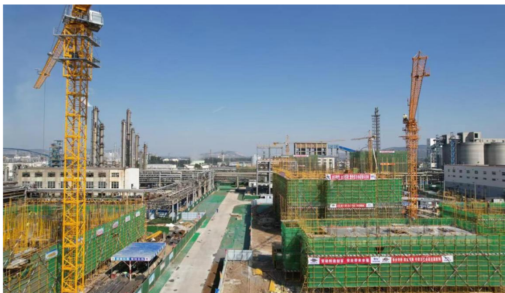
己内酰胺产业链配套节能减碳一体化工程项目

己内酰胺节能减碳一体化项目开工，克服疫情影响提前16天完成全年节点目标。鲁南储配煤基地一期50万吨项目提前完成静态储煤考核目标，获得集团公司重点工作通报表扬。