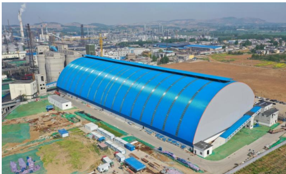
煤场封闭改造项目